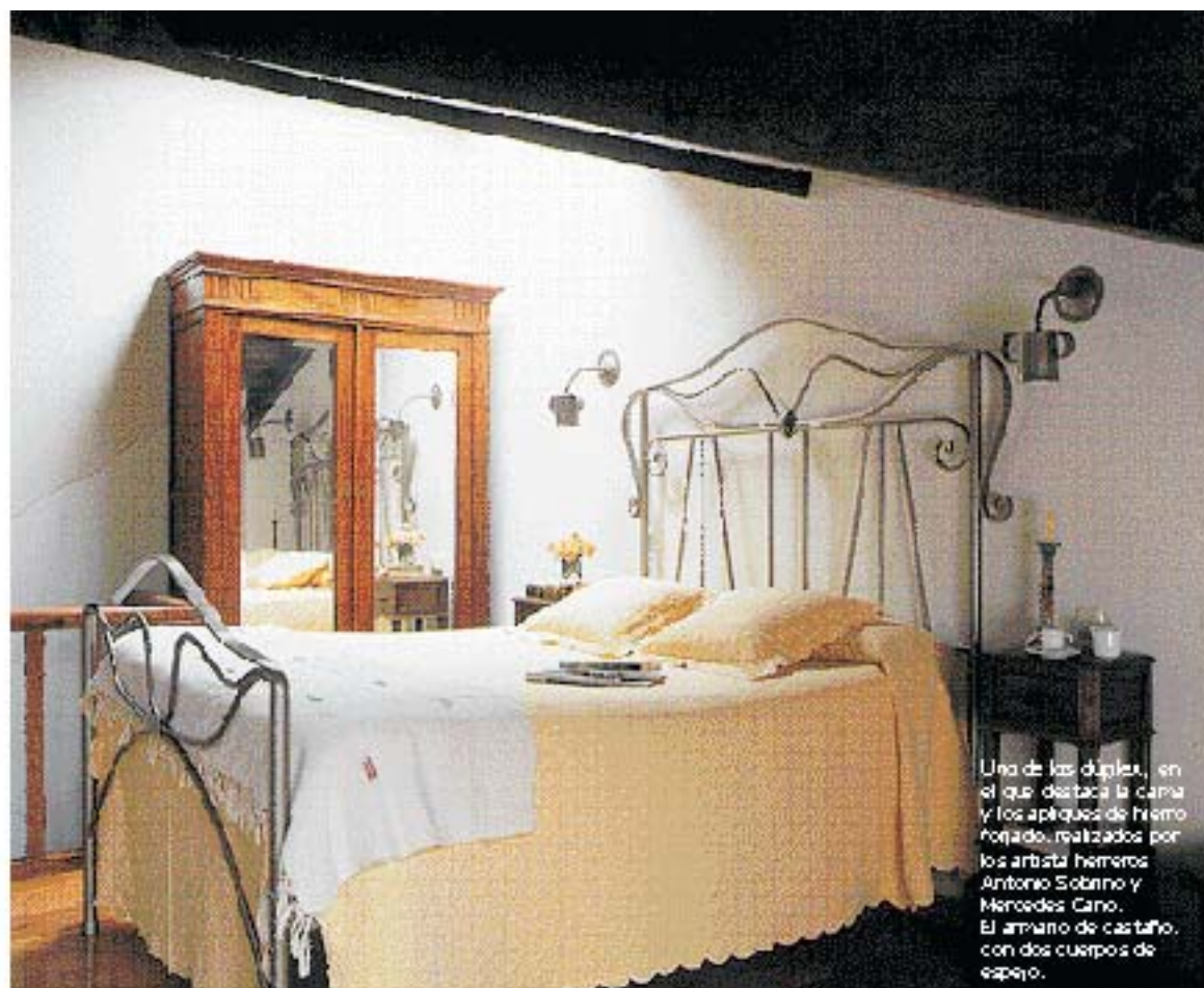
Uno de los duplex, en el que destaca la cama y los apliques de hierro forjado, realizados por los artistas hermanos Antonio Sobano y Mercedes Cano. El armario de castaño, con dos cuerpos de espejo.