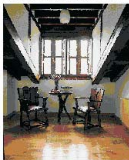
▼ Un rincón del duplex, con una coqueta zona de estar, compuesta por dos sillas holandesas, adquiridas en Portugal, y una mesa Tomé, diseño modernista de 1902, comprada en Antigüedades Pelino. En la foto se aprecia el entramado de vigas del techo y el