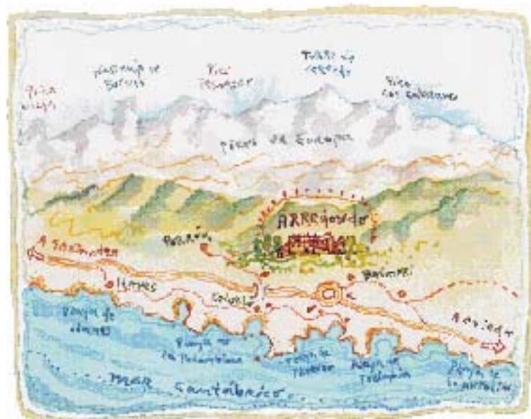
▲ Cómo llegar y qué visitar. Si vas desde Oviedo, toma la Autovía del Cantábrico, dirección Santander. Pasado Ribadesella y poco antes de llegar a Llanes, coge el desvío, primero hacia Colono y, después, hacia Portúa, pasando un puente elevado. A los pocos metros encontrarás indicaciones que te llevan al hotel. Desde aquí tienes fácil acceso a muchas playas de la comarca: Barro.